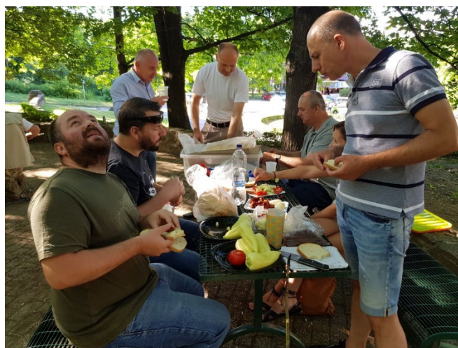
A hagyományos nyársalás a Szépasszony völgyében

Emellett a tagok aktívan részt vettek az Eger keleti elkerülő út véleményezésében, ill. személyesen részt vettem a társadalmi egyeztetésen, mely az önkormányzat és a beruházó NIF vezérletével történt.