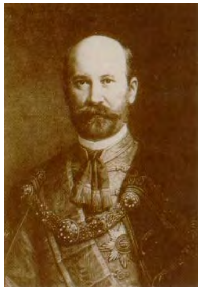
báró Baross Gábor

1848. 06. 06. (Pruzsina) – 1892. 05. 09. (Budapest)