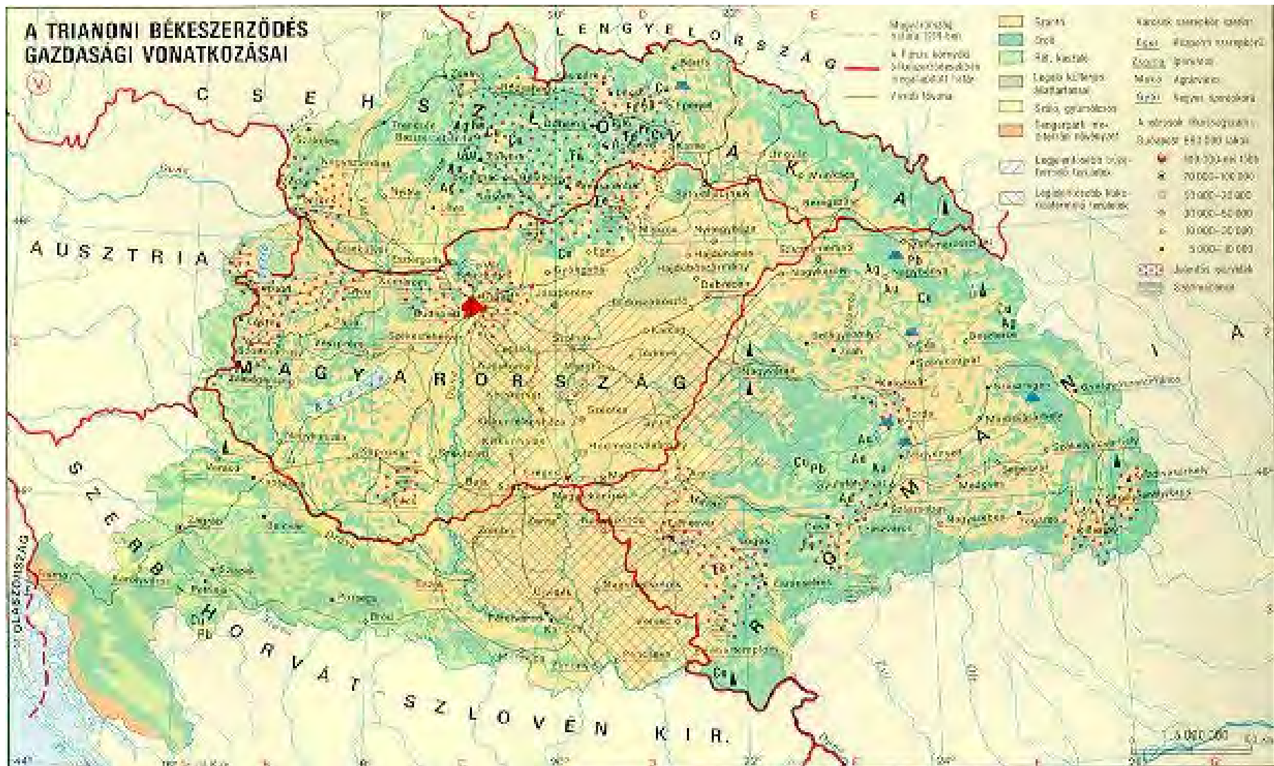
II. ábra Magyarország az 1920 - 1938 közötti időszakban