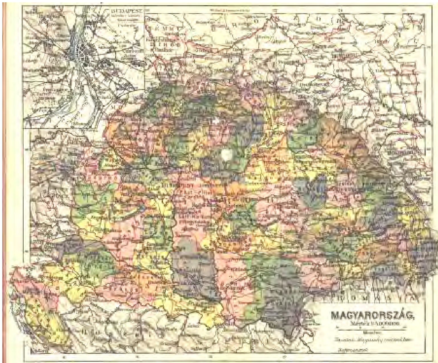
I. ábra Magyarország 1920-ig