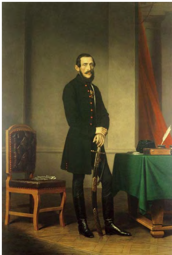
XXVI. ábra Csány László

Kovács Jenő: A közlekedésügy helyzete a magyar kormányokban 1848 - 2010