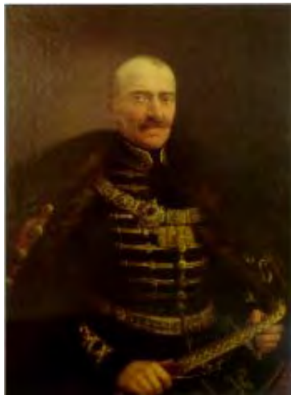
gróf Mikó Imre

1805. 09. 04. (Zabola) – 1876. 09. 16. (Kolozsvár)