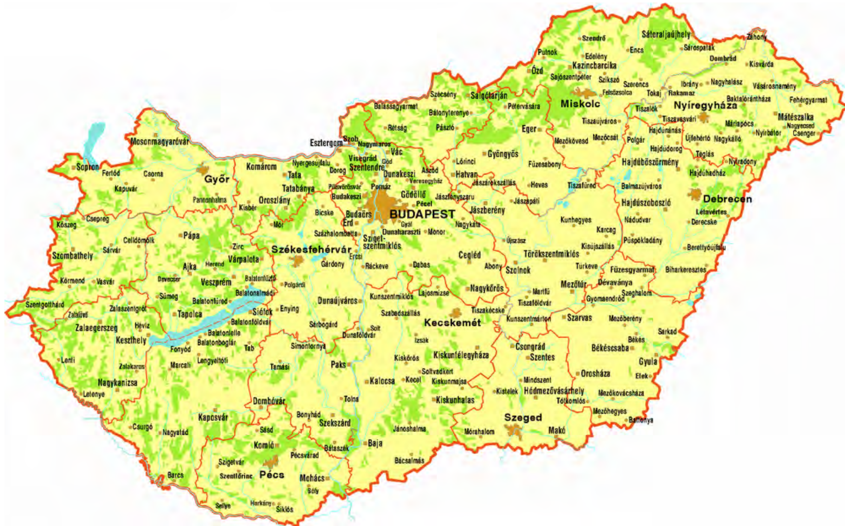
IV. ábra Magyarország 1945-től napjainkig