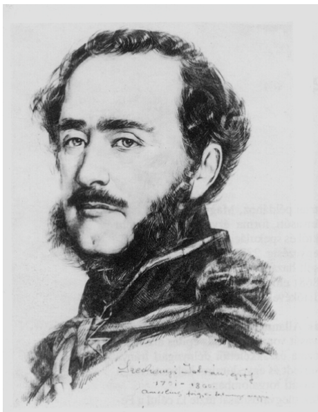
Széchenyi István gróf

1791. 09. 21. (Bécs) – 1860. 04. 08. (Döbling)